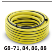
68-71, 84, 86, 88