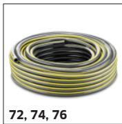
72, 74, 76