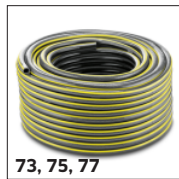
73, 75, 77